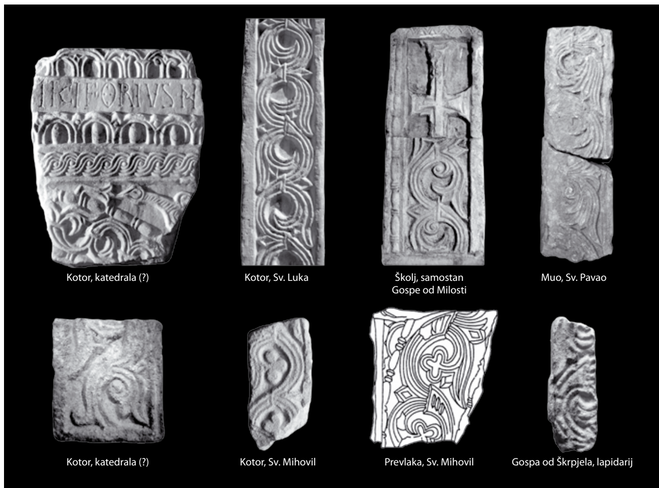
2. Kotorska klesarska radionica, izbor reljefa s različitim varijantama motiva sinusoidne vitice s ljevkastim proširenjima iz Boke kotorske

Stone-carving Workshop of Kotor, selected fragments with variants of sinusoid foliage with cone-shaped extensions, Boka Kotorska