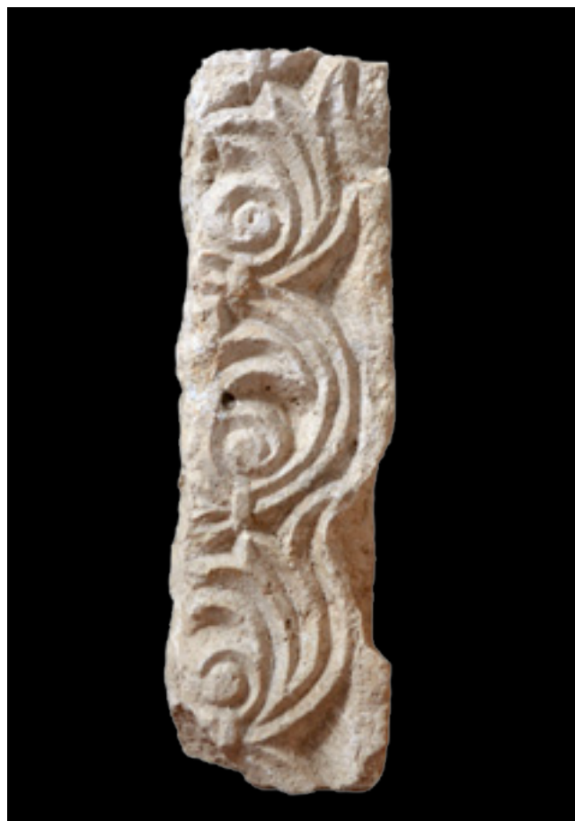
12. Kotorska klesarska radionica , ulomak grede iz Starog Bara, Bar, Zavičajni muzej

Smatram da je upravo ovakav način rada na terenu ključan za širenje djelokruga radionice i za priskrbljivanje novih narudžbi. Ukoliko su njihov broj i učestalost