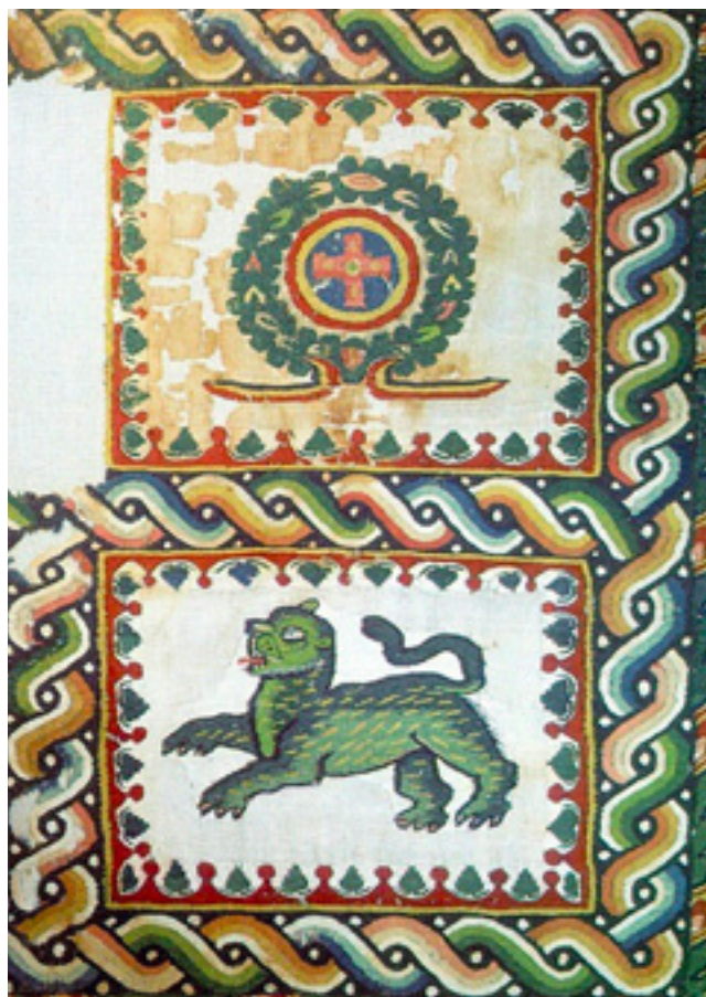
5. Koptska tkanina sa srodnim motivom lava (Kairo, Koptski muzej) Coptic fabric with an analogous lion motif (Coptic Museum, Cairo)

No, pored ovih tehničkih nedosljednosti, Kotorska klesarska radionica odlikuje se puno bogatijim repertoarom motiva i predložaka koje uz mnogo veću dozu slobode i kreativnosti kombinira na različitim plohamo liturgijskih instalacija. Umjetnici će tako kuke, osim na arhitravima klesati i na plutejima s omiljenim kružnim motivima, učvorenim kružnicama s rozetama ukrašavati će kapitule, arhitrave i imposte (sl. 4), a frizove arkadica s palmetama osim na ravne grede (sl. 6) postavljati će i u koncentrične krugove na velikim kružnim kompozicijama. Trolisti se izvode samostalno, nižu se uokolo kapitela (sl. 8) ili jedan na drugome oblikujući akantusov cvijet, kombiniraju se po četiri unutar učvorenih kružnica te zajedno s polovinom rozete formiraju palmetice (sl. 6)... Sve je to u službi izrazitog horror vacui , što govori o formalnom, ali i stilskom pomaku u odnosu na prethodnu produkciju. Maštovita upotreba jednostavnih geometrij-