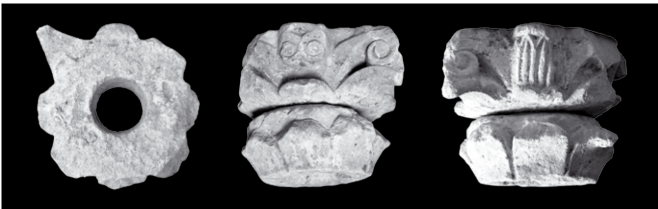
7. Kotorska klesarska radionica , kapitel, crkva Sv. Stefana, Vranovići

Stone-carving Workshop of Kotor, capital, Vranovići, St Stephen's church