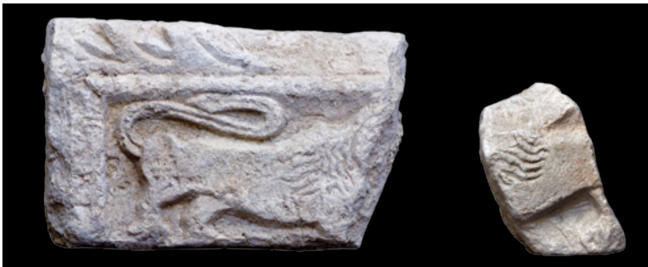
3. Kotorska klesarska radionica , ulomci trabeacije s reljefima lavova iz crkve Sv. Mihovila, Kotor, Lapidarij Stone-carving Workshop of Kotor, fragments of trabeation with lion reliefs from St Michael's church in Kotor, Lapidarium of St Michael

cama, klesari Kotorske radionice od nje preuzimaju samo jedan tip – onaj tropruti s karakterističnim ljevkastim proširenjima na stabljici i krupnim trolisnim cvjetovima u krugovima vitice. Jedan je to od najosebujnijih i najučestalijih motiva bokeljske predromaničke plastike koji je tada, ne zaboravimo, krasio i mramornu oltarnu ogradu kotorske katedrale, klesanu u vrijeme biskupa Ivana. 9 Mlađa generacija majstora ne prenosi ju uvijek direktno od svojih uzora, već ju dalje varira na razne načine dodavanjem ili izostavljanjem malenih volutica u središtu, dopunjavajući ju ponekad romboidnim pupoljcima ili trolisnim umetcima uz vanjske rubove (sl. 2, sl. 11 Šipan, Koločep i Rožat, sl. 14 Lješ). Takvi su vitičasti motivi bili posebno omiljeni za ukrašavanje užih uspravnih ploha pilastara, vrlo često u kombinaciji s profiliranim križem koji na vrhu izrasta iz vitice, što je kompozicija prisutna i kod klesara iz Ivanova vremena.