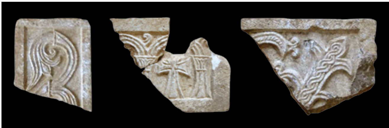
14. Ulomci liturgijskih instalacija pronađeni u istraživanjima grobne crkve citadele u Lješju

Fragments of liturgical equipment uncovered during the excavations of the cemetery church in the citadel of Lezha