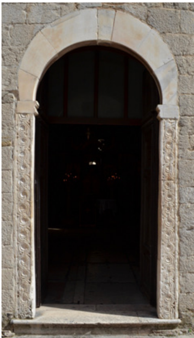
10. Kotor, portal romaničke crkve Sv. Luke sa spoliranim mramornim dovratnicima Kotorske klesarske radionice Kotor, portal of the Romanesque church of St Luke with spolia marble jambs, Stone-carving Workshop of Kotor

Posebno značajna uloga u tome procesu pripadala je benediktincima. Širenje tog reda na području Boke, kao i općenito na južnom dalmatinskom primorju, Ivan Ostojić datirao je tek od 11. stoljeća nadalje. 32 Međutim, sada kad imamo saznanja o čak četiri benediktinska lokaliteta – Sv. Mihovil u Kotoru i na Prevlaci, Sv. Juraj pred Perastom i Sv. Marija u Rosama na Lušnici – koje sustavno oprema ista klesarska radionica tijekom prve polovine 9. stoljeća, možemo pouzdano potvrditi njihovu prisutnost u zaljevu već u to doba. Ovome broju treba pridodati i samostan Sv. Petra na Šuranju pred južnim zidinama Kotora, istražen nakon Drugog svjetskog rata, čiji su ostaci datirani nakon 841. godine, iako bez tragova predroma-