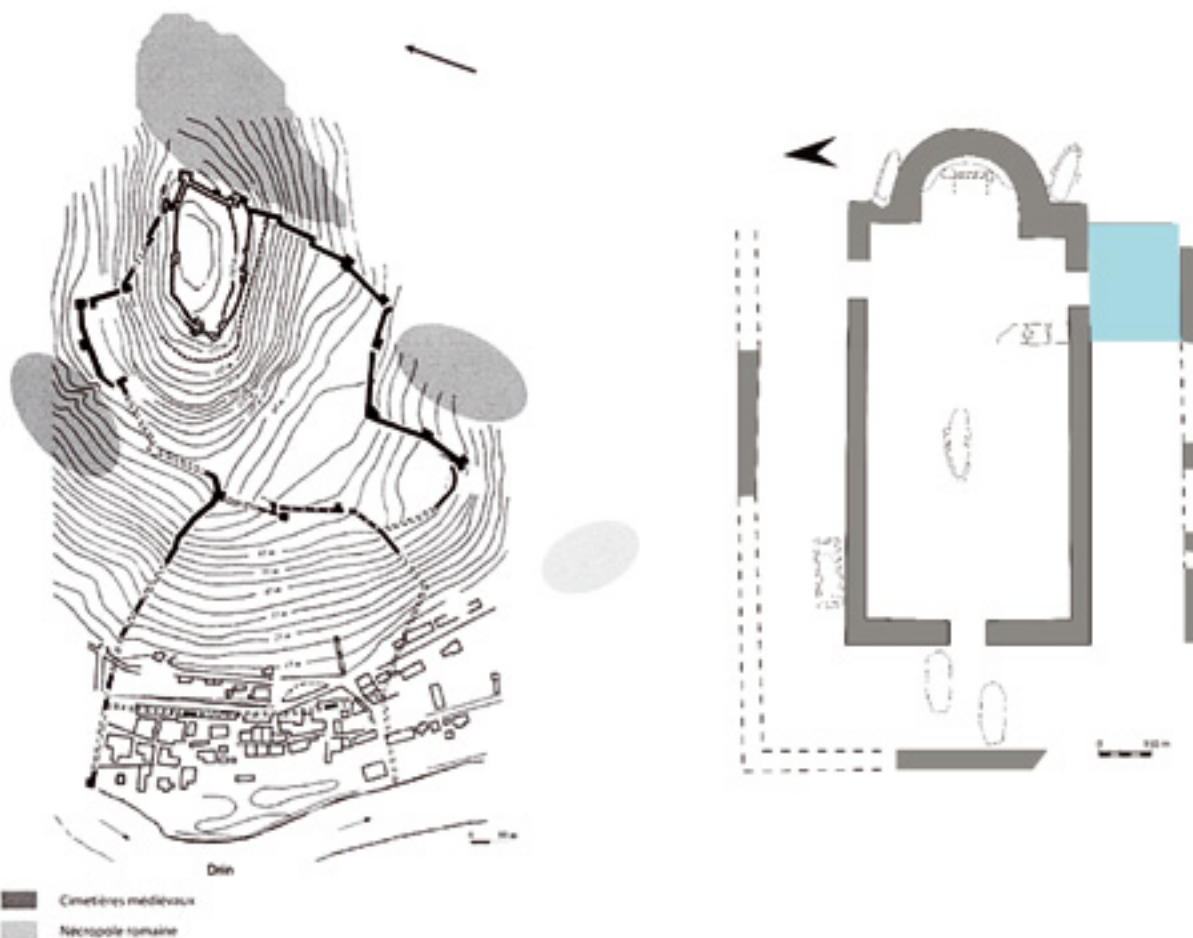
13. Lijevo: tlocrt Lješa s označenim položajem antičke te srednjovjekovnih nekropola. Desno: tlocrt grobne crkve istočne nekropole Map of Lezha with the indicated position of an ancient necropolis and several medieval ones; to the right: ground plan of a cemetery church in the eastern necropolis

Ciboriji u Budvi i Ulcinju u literaturi već su poznati i pravilno interpretirani. 46 Onaj u Budvi bio je kao jedina liturgijska instalacija unesen u monumentalnu trobrodnu ranokršćansku baziliku prilikom njezine obnove, koristeći starije pluteje koji su u crkvi najvjerojatnije dijelili središnji od bočnih brodova, o čemu svjedoči sačuvana rubna profilacija na stražnjoj strani nekolicine ulomaka. 47 Ansambl u Ulcinju bio je, što je dosada ostalo nezapaženo, osim ciborija sastavljen i od oltarne ograde s trabeacijom, sudeći prema ulomku arhitrava s prepoznatljivim kukama i reljefno istaknutim natpisnim po-