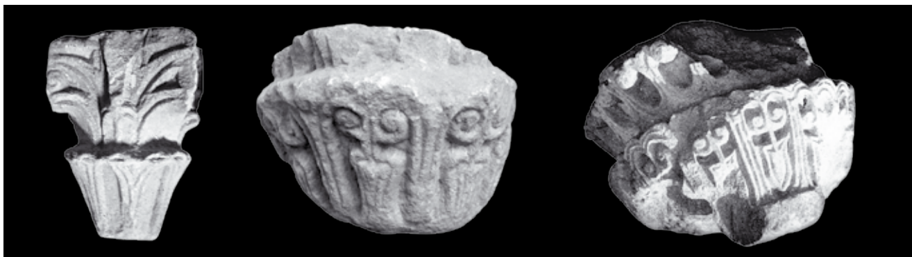
8. Kapiteli Kotorske klesarske radionice . Lijevo i sredina: Kotor, depo katedrale Sv. Tripuna (foto: M. Zornija). Desno: Dubrovnik, lapidarij Arheološkog muzeja (izvor: ROMANA MENALO /bilj. 20/, 62, sl. 55)

Capitals of the Stone-carving Workshop of Kotor. Left and center: Kotor, depot of St Tryphon's cathedral. Right: Dubrovnik, lapidarium of the Archaeological Museum