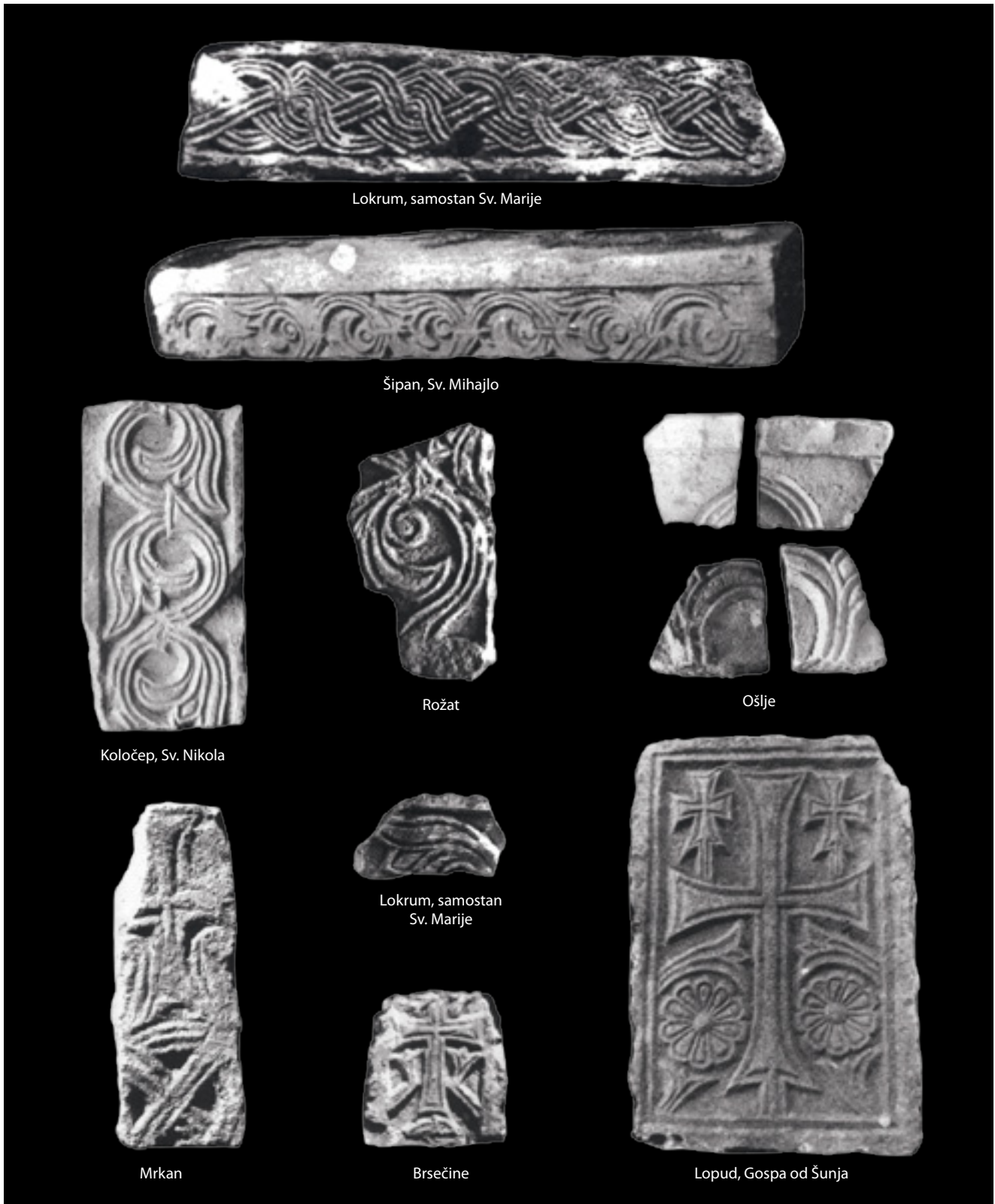
11. Kotorska klesarska radionica , ulomci reljefa s dubrovačkog područja (izvor: Lokrum i Rožat – IVICA ŽILE /bilj. 39/, sl. 3 i 13; Šipan – JOSIP POSEDEL, Predromanički spomenici otoka Šipana , SHP, III/2, 1952.; Koločep – IVICA ŽILE /bilj. 42/, T. XVI, sl. 1; Ošlje, Mrkan i Lokrum – ROMANA MENALO /bilj. 20/, 28, sl. 10 i 52; Brsečine i Lopud – TOMISLAV MARASOVIĆ /bilj. 50/, 69 i 243)

Stone-carving Workshop of Kotor, fragments of reliefs from the wider Dubrovnik area