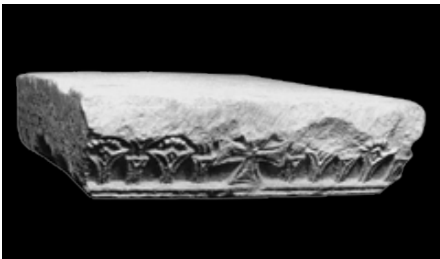
6. Kotorska klesarska radionica , impost kapitel iz memorije Sv. Tripuna, Kotor, depo katedrale (izvor: MILKA ČANAK-MEDIĆ – ZORICA ČUBROVIĆ /bilj. 19/, 40, sl. 37)

Stone-carving Workshop of Kotor, impost capital from the memoria of St Tryphon, Kotor, depot of St Tryphon's cathedral