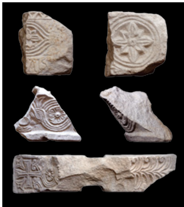
4. Kotorska klesarska radionica , izbor ulomaka iz crkve Sv. Mihovila, Kotor, Lapidarij. Gore – arhitrav ili nadvratnik ukrašen s dvije susjedne strane; sredina – kapitel; dolje – impost bifore Stone-carving Workshop of Kotor, Fragments from St Michael's church in Kotor, Lapidarium of St Michael. Above: architrave or lintel decorated in two adjacent sides; centre: capital; below: impost capital of the bifora window

govore koliko o klesarima i njihovim predlošcima, toliko i o samim naručiteljima. Na benediktinskim lokalitetima u Sv. Mihovilu kotorskom i prevlačkom, ali i na ulomku iz Komolca, radi se o slavenskoj riječi LAV, dok je u